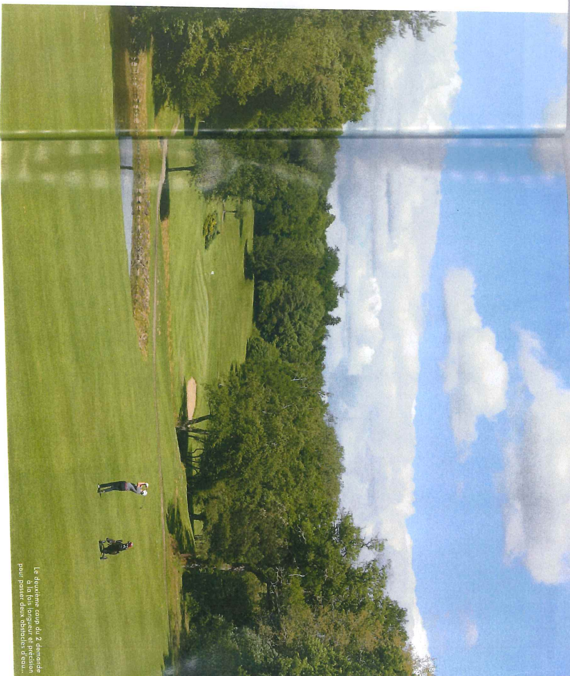
L'enclume du 6, comme souvent sur les parcours de Nantes-Vigneux, demande un coup chirurgical pour un green à l'imbricable poste.

DE NOTRE ENVOYÉ SPÉCIAL EN LOIRE-ATLANTIQUE, THIERRY PERRIN (TEXTE ET PHOTOS)